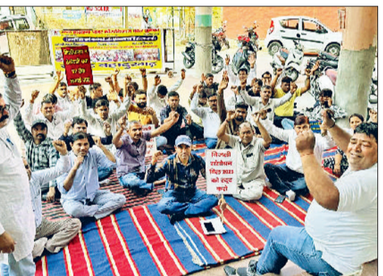
बहादुरगढ़। नारेबाजी करते धरनातर बिजली कर्मचारी।

में निजी लाइसेंसधारकों को सरकारी बिजली ढांचे के उपयोग की अनुमति देने और क्रॉस-सब्सिडी खत्म करने जैसे प्रावधान हैं। इससे निजी कंपनियों केवल लाभदायक उपभोक्ताओं को चुनेंगी, जबकि