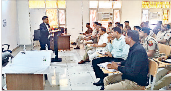
झज्जर। सेमिनार के दौरान उपस्थित अनुसंधानकर्ताओं को संबोधित करते हुए

स्थानीय पुलिस लाइन मैदान में मादक पदार्थों से जुड़े मामलों की जांच को और प्रभावी बनाने के उद्देश्य से एनडीपीएस एक्ट को लेकर एक सेमिनार का आयोजन किया गया। सेमिनार में जिले की विभिन्न पुलिस यूनिटों के अनुसंधानकर्ताओं ने भाग लिया