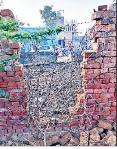
झंझर। प्लाट की टूटी हुई दीवार।