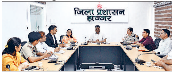
झज्जर। बैठक में आवश्यक दिशा निर्देश देते हुए डीसी स्वप्निल रविंद्र पाटिल।

जिले को नशा मुक्त बनाने के लक्ष्य को लेकर मंगलवार को लघु सचिवालय में डीसी स्वप्निल रविंद्र पाटिल की अध्यक्षता में जिला स्तरीय नाकों समन्वय समिति की मासिक बैठक आयोजित हुई। डीसी ने कहा कि जिला के 124 गांवों और 15 वार्डों को नशा मुक्त घोषित किया जा चुका है। सभी गांवों को नशा मुक्त बनाने के लक्ष्य को लेकर आपसी समन्वय से कार्य करना होगा। उन्होंने निर्देश दिए कि हर उपमंडल स्तर पर नशा मुक्ति अभियान को तेज किया जाए। उन्होंने कहा कि गांव और वार्ड स्तर पर पहले से गठित टीमों को एक्टिव