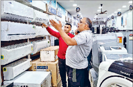
झंझर। एक दुकान में एसी बारे जानकारी लेते हुए ग्राहक व कूलर की जालियां साफ करते हुए लोग।

मौसम में आए बदलाव के कारण लोगों को तपन महसूस होने लगी है। ऐसे में लोगों का रुझान पंखों, कूलर व एसी की ओर बढ़ रहा है। ऐसे में बाजार में भी इसका असर दिखाई देने लगा है। गर्मी को देखते हुए आगामी दिनों में एसी की डिमांड और अधिक बढ़ने की संभावना है। दुकानदारों का कहना है कि हालांकि अभी जितनी इन्वेंट्री आ रही है उस औसत के हिसाब से एसी की बिक्री नहीं हो पा रही लेकिन आगामी दिनों में बिक्री में इजाफा होगा। अधिकतर लोग कीमत, बिजली की खपत व अलग-अलग कंपनियों के मॉडलों संबंधी जानकारी ले रहे हैं।