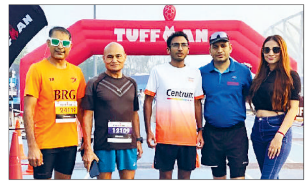
बहादुरगढ़। स्टैडियम रन में उपलब्धि हासिल करने वाले बीआरजी के धावक।