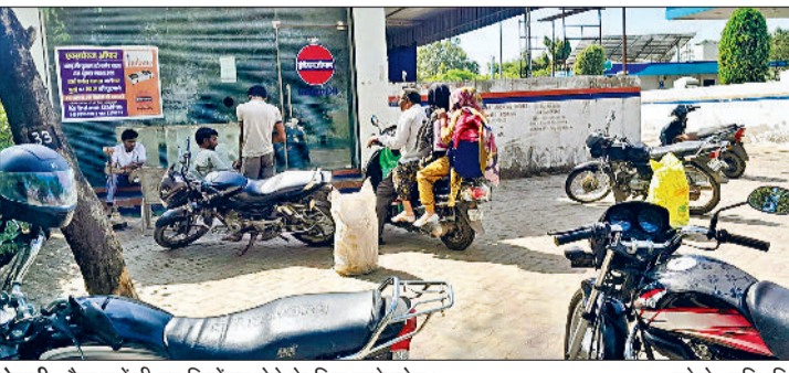
रेवाड़ी। गैस एंजनीयों पर सिलेंडर लेने के लिए खड़े लोग।

हो जाते थे। युद्ध शुरू होने के बाद एक ओर सरकार ने घरेलू गैस सिलेंडरों के दाम में 60 रुपये तक की वृद्धि कर दी है, तो दूसरी ओर उपभोक्ताओं के लिए बार-बार गैस सिलेंडर लेने का रास्ता भी बंद हो गया है। किसी भी उपभोक्ता को गैस कंपनियों से डीएससी कोड लिए बिना सिलेंडर नहीं दिया जा रहा है। यह कोड भी अब 15 दिन की बजाय 25 दिन बाद मिलने लगा है, जिससे अधिक खपत वाले बड़े परिवारों के लिए माह में एक बार से ज्यादा बार सिलेंडर लेना मुमकिन नहीं रहा है। गैस का अधिक इस्तेमाल करने वाले लोगों के लिए अब गैस की बचत करना भी जरूरी हो गया है। खपत कम नहीं करने पर उन्हें एक बार फिर से रूढ़न के चूल्हों या अन्य विकल्पों की तलाश करनी होगी।