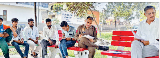
झंझर। नागरिक अस्पताल परिसर में पोस्टमार्टम के लिए कागजी कार्रवाई करते हुए पुलिसकर्मी।

गुरुग्राम मार्ग पर पूर्णमल मंदिर मोड़ के नजदीक हुआ सड़क हादसा