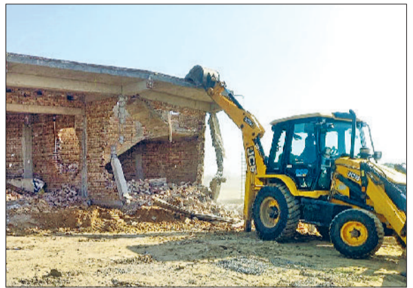
रेवाड़ी। अवैध दुकानों को तोड़ती जेसीबी।

पुलिस बल की मौजूदगी के चलते डीटीपी की इस कार्रवाई का कोई विरोध नहीं हुआ