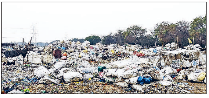
बहादुरगढ़। खेत में फसल की जगह लगा प्लास्टिक कबाड़ का ढेर।

विशेषज्ञों का मानना है कि यदि खेती को लाभकारी बनाने के लिए ठोस कदम नहीं उठाए गए, तो आने वाले समय में अधिक किसान गैर-कृषि कार्यों की ओर रुख कर सकते हैं।