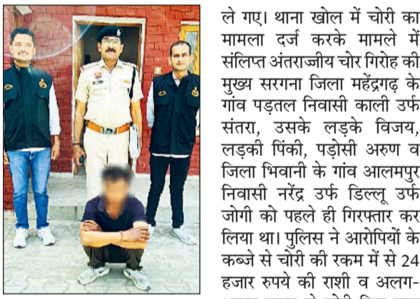
रेवाड़ी। पुलिस गिरफ्तार में आरोपी।

सीआईए कोसली ने अंतर्राज्यीय चोर गिरोह के एक सदस्य को गिरफ्तार करने में सफलता हासिल की है। आरोपी राजस्थान में गुलेल गैंग के नाम से चोरी का आतंक फैलाने वाले गिरोह का सदस्य है, जिसके पांच सदस्यों को पुलिस पहले ही गिरफ्तार कर चुकी है। आरोपी को कोर्ट से 2 दिन के रिमांड पर लिया गया है।