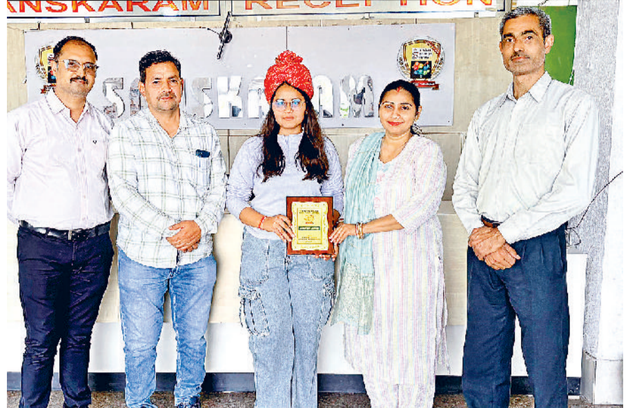
झज्जर। होनहार छात्रा को सम्मानित करते हुए शिक्षक।